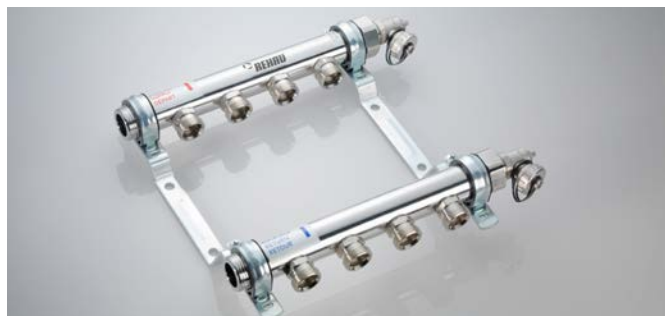
Nemesacél fűtővezeték osztó-gyűjtő: különösen kompakt a csökkentett leágazási távolságok miatt.

A csövekből, idomokból és tartozékokból álló választékunkkal minden lényeges bekötési változat megvalósítható. A bekötő vezetékek elosztására és összegyűjtésére szolgáló fűtővezeték osztó-gyűjtők teszik teljessé a termékválasztékot.