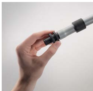
2 Az idom bedugása