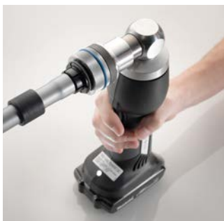
1 A csővég feltágítása