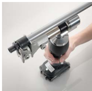
3 A toldóhüvely felpréselése